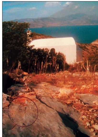
5. Θέση σπείρας Αγίου Αθανασίου.