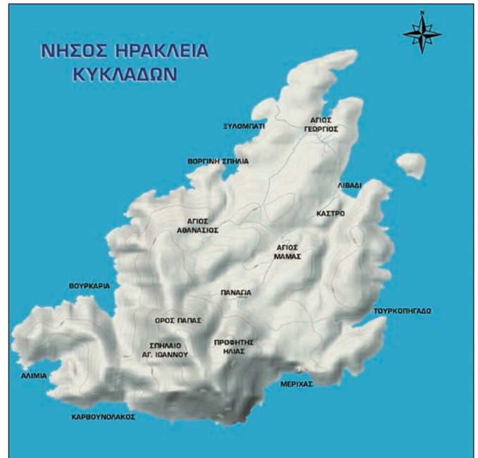
1. Χάρτης της Ηρακλειάς.

Η Ηρακλειά έχει δύο οικισμούς: τον Άγιο Γεώργιο, που