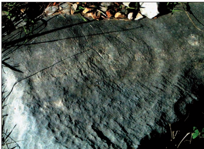
17. Σπείρα 7 από τη συστάδα με τις σπείρες.

που τους καθιστά ιδιαίτερα ευάλωτους και χρήζουν άμεσης προστασίας (εικ. 3).