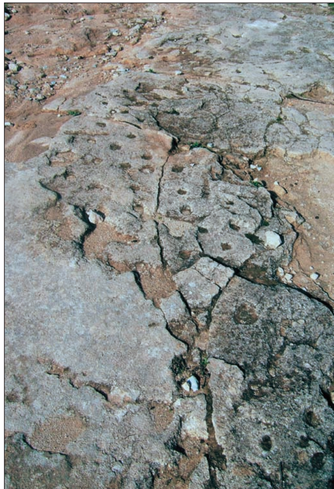
23. Τμήμα μεγάλης βραχογραφίας.