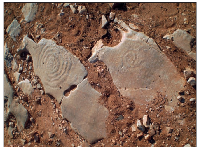
3. Σπείρες στο δρόμο.