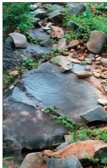
19. Σπείρα 9 από τη συστάδα με τις σπείρες.

Το 2006 εντοπίστηκε συστάδα με έξι αρχικά σπειροειδείς βραχογραφίες. Βρίσκονται σε χαμηλό λόφο βορειοδυτικά και σε μικρή απόσταση από τον «μπούσουλα» της εικόνας 3 (εικ. 11-16). Τον Νοέμ-