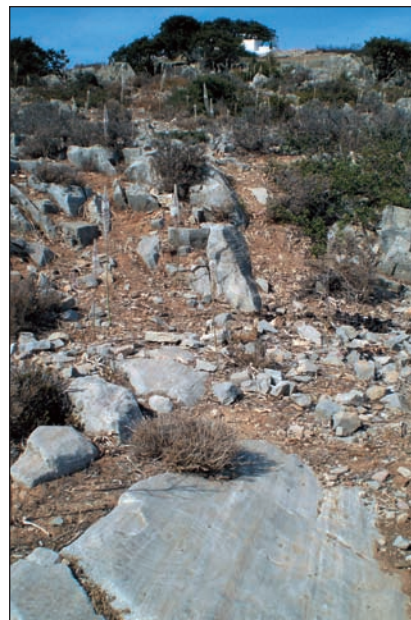
9. Θέση σπείρας στον Άγιο Μάμα.