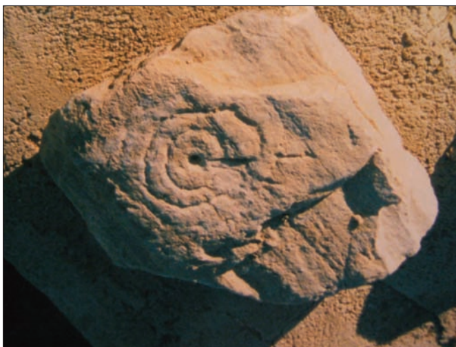
2. Σπείρα σε πέτρα στο χωριό Παναγία.

Η Ηρακλειά κατά τον 16ο αιώνα υπαγόταν στην Πατριαρχική Εξαρχία με την ονομασία «Ηρακλειτσα». Από το 1646, μαζί με τις άλλες πατριαρχικές νήσους Ανάφη, Αστυπάλαια, Ίο, Φολέγανδρο και Σίκινο, αποτελεί μέρος της Αρχιεπισκοπής Σίφνου.