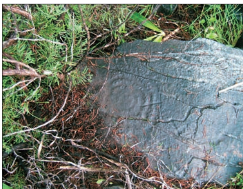
18. Σπείρα 8 από τη συστάδα με τις σπείρες.

Το 2001 πήγα στην ΚΑ΄ Εφορεία Προϊστορικών και Κλασικών Αρχαιοτήτων με τις φωτογραφίες για να μάθω τι ακριβώς ήταν αυτά τα σχήματα. Εκεί μου εξήγησαν ότι τα σημάδια δεν είχαν γίνει από πειρατές, αλλά ήταν σύμβολα χαρακτηριστικά της Πρώιμης Εποχής του Χαλκού. Επίσης, ότι ο τρόπος με τον οποίο είχαν κατασκευαστεί ήταν η επαναλαμβανόμενη κρούση της επίπεδης επιφάνειας με αιχμηρό αντι-