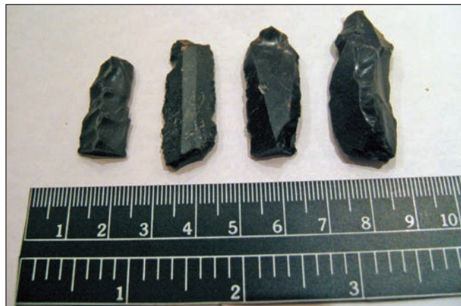
25. Εργαλεία από οψιανό.