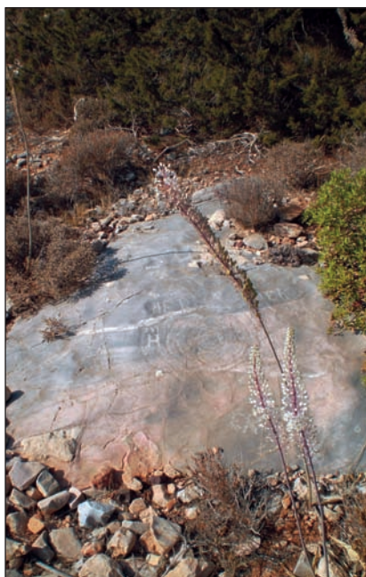
6. Σπείρα Βορινής Σπηλιάς.