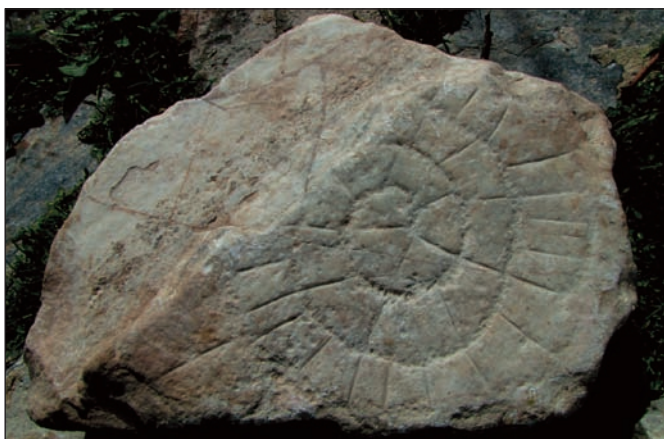
24. Ταινιωτή διπλή σπείρα.