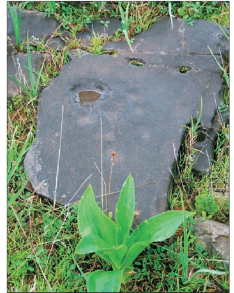
22. Σπείρα 12 από τη συστάδα με τις σπείρες.

βριο του 2009 εντοπίστηκε κοντά στις έξι αυτές άλλη μία από τον Γιάννη Γαβαλά (εικ. 17).