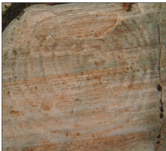
8. Σπείρα στον Άγιο Μάμα.