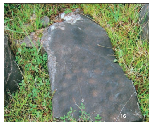
11-16. Σπείρες 1-6 από τη συστάδα με τις σπείρες.