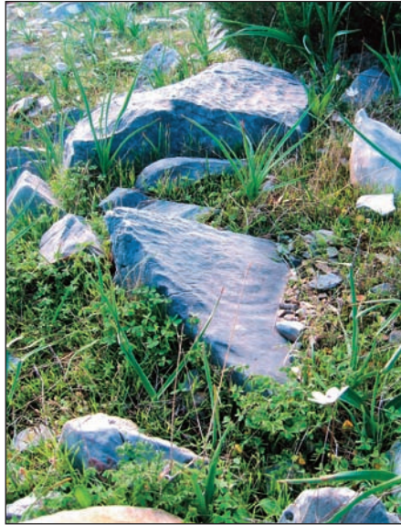
21. Σπείρα 11 από τη συστάδα με τις σπείρες.