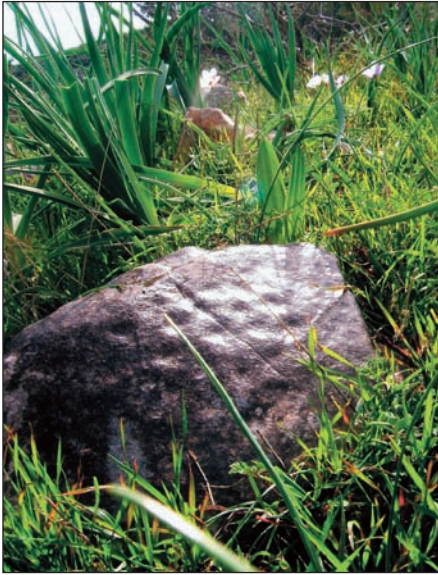
20. Σπείρα 10 από τη συστάδα με τις σπείρες.