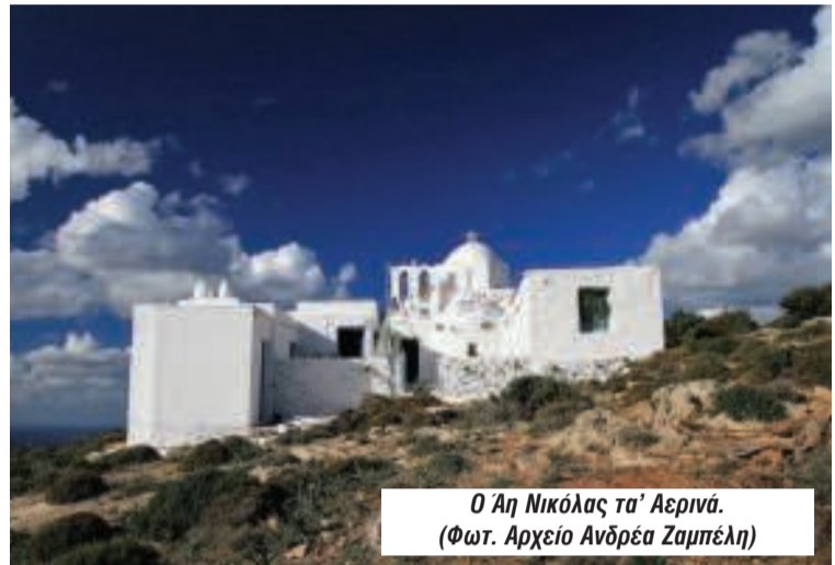
Ο Άη Νικόλας τα' Αερινά.

Είναι όλα αυτά τα αντικείμενα που μας πιάνουν χώρο και όλο λέμε να τους δώσουμε μια και να ησυχάσουμε αλλά ποτέ δε μας πάει η καρδιά να το κάνουμε. Είναι όλα αυτά που όπως λέει ο ποιητής "μας εξαντλούν τους αγώνες και δε ξέρουμε που να τα ακουμπήσουμε". Είναι η "μικρή" μας κληρονομιά που παρότι δε φέρει καμιά ιδιαίτερη ιστορική, αισθητική ή άλλη αξία, κατέχει μια ιδιαίτερη θέση στη καρδιά και τη συνείδηση μας, έχει όπως λέμε αξία καθαρά συναισθηματική. Η πολιτιστική κληρονομιά όμως έχει πάψει στο αξιακό σύστημα του δυτικού κόσμου να αξιολογείται με συναισθηματικά κριτήρια. Αποτελεί πια περιουσιακό τεκμήριο, και μάλιστα με