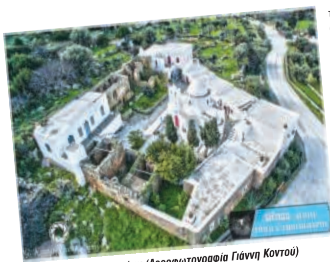
Η μονή Φυρογίων

Σε μια συγκινητική ατμόσφαιρα τελέστηκε η Θεία Λειτουργία της γιορτής της Παναγίας στην Ι. Μονή Φυρογίων με αρκετούς προσκυνητές και δυο τάξεις από το Δημοτικό Σχολείο που είναι απέναντι από την Μονή. Ο Σύλλογος Γυναϊκών «ΤΟ ΣΜΑΡΙ» όπως πάντα ευαίσθητος ήταν εκεί για τα παιδιά. Τους πρόσφερε ένα μικρό κέρασμα. Τα γλυκά ματάκια τους και οι αγαπημένες φωνούλες όλων μαζί, «Σας ευχαριστούμε πολύ...» είναι αυτό που αν δεν το ζήσεις... δεν περιγράφεται!