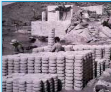
Δεκαετία του 1950. Πριν την παρακμή του πηλινού τσικαλιού, η παραγωγή έτοιμη να φορτωθεί στο καϊκι από την παραλία του Φάρου.