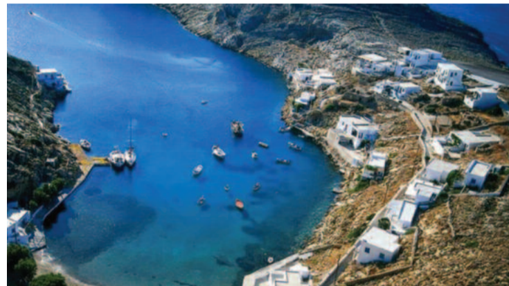
Η παραδεισένια και «αμόλυνη», ευτυχώς, ακόμα Χερρόνησος. Έχουν κάθε δικαίωμα οι κάτοικοι της να θέλουν να την προστατεύσουν (Από ανάρτηση στο Facebook)

(ΦΕΚ 917/Β/14-7-1976) ως τόπος ιδιαίτερου φυσικού κάλλους, δεν έχει αποσαφηνιστεί μέχρι σήμερα ο φορέας (ή οι συναρμόδιοι φορείς) που έχει την αρμοδιότητα και την υποχρέωση προστασίας του και εμπράκτως μπορεί να ενεργήσει προς την κατεύθυνση αυτή. Ζητάμε την άμεση παρέμβαση των Υπηρεσιών για την προστασία των "υπολειμμάτων" της περιοχής της Πουλιάτης που έχει "κατασπαραχθεί" καθώς και: 1. Να απαγορευθούν τα υπόσκαφα που αλλοιώνουν τη φυσιογνωμία του νησιού. 2. Να απαγορευθούν οι ιδιωτικές πισίνες (όπως ισχύει στη γειτονική Σέριφο με το Π.Δ. 930 Δ/24.10.2002), κυρίως λόγω της έντονης λειψυδρίας που παρατηρείται στα άνυδρα νησιά μας, ειδικά κατά τους θερινούς μήνες με την ολόενα και αυξανόμενη τουριστική κίνηση. 3. Να απαγορευτεί η κατασκευή εμφανών λιθοδομών (η τοιχοποιία να ασπρίζεται σύμφωνα με τα παραδοσιακά πρότυπα). 4. Να ορισθεί στην εκτός σχεδίου δόμηση τα κτίσματα να είναι ισόγεια με ανώτατο ύψος τα 4,5 μέτρα, όπως προβλέπεται στο σχετικό Διάταγμα για τη Σέριφο (ΦΕΚ 930 Δ/24.10.2002). 5. Να αποσαφηνιστεί ποιος είναι ο φορέας (ή οι συναρμόδιοι φορείς) που έχει την ευθύνη της προστασίας της Σίφνου ως τοπίου με ιδιαίτερο φυσικό κάλλος (σύμφωνα με το Π.Δ.). Φορείς, κάτοικοι και φίλοι της Σίφνου αγωνιούν!