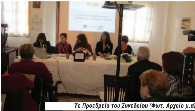
Το Προεδρείο του Συνεδρίου

Σύλλογοι Γυναικών υπάρχουν πια σχεδόν σε κάθε νησί (αν δεν κάνω λάθος εκτός της Νάξου!) Το Συνέδριο πραγματοποιήθηκε στον Πλατύ Γιαλό, στο ξενοδοχείο Μπενάκη και στην εναρκτήρια συνεδρίαση, το απόγευμα της Παρασκευής 21 Απριλίου, με παρουσία πλήθους κόσμου – κυρίως γυναικών φυσικά – και των αντιπροσωπειών που το πρωί της ίδιας μέρας με τη φροντίδα του «Σμάρι» και της ΔΗΚΕΣ ξεναγήθηκαν στο νησί.