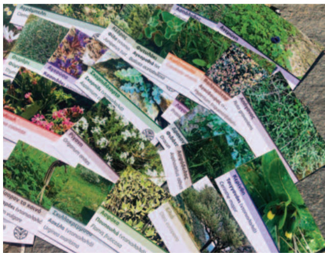
Μερικά από τα φυτά του βοτανικού μονοπατιού με τις πινακίδες τους.

Στην αρχή του μονοπατιού τοποθετήθηκε μεγάλη επεξηγηματική πινακίδα και στην διαδρομή μικρότερες πινακίδες που δείχνουν τις φωτογραφίες του κάθε φυτού και αναφέρουν την λατινική ονομασία, την κοινή ελληνική και την ονομασία στην ντοπιολαλιά - όπου υπήρχε. Έχουν ταυτοποιηθεί και φωτογραφηθεί 33 διαφορετικά φυτά και σήμερα τοποθετήθηκαν οι περισσότερες από τις ταμπελίτσες στα φυτά που υπάρχουν αυτή την εποχή στο μονοπάτι με σκοπό την ολοκλήρωση του ως τον προσεχή χειμώνα με την τοποθέτηση και των φθινοπωρινών και χειμωνιάτικων φυτών.