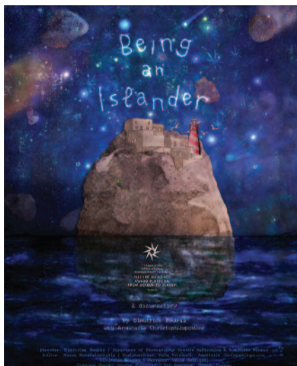
Η αφίσα του ντοκιμαντέρ

Το ντοκιμαντέρ οπτικής Ανθρωπολογίας "Being an Islander" (Το να είσαι νησιώτης), του οποίου τα γυρίσματα έγιναν εξ ολοκλήρου στην Σίφνο, και η παραγωγή του οποίου ήταν υπό την αιγίδα του Δήμου Σίφνου (με ομόφωνη απόφαση του Δημοτικού Συμβουλίου), συμμετείχε στο 25ο Διεθνές Φεστιβάλ Ντοκιμαντέρ Θεσσαλονίκης (TiDF25) και απέσπασε το "Βραβείο Κοινού Fischer" (Fischer Audience Award) για τις κατηγορίες που συμμετείχε, δηλαδή "Platform" (ντοκιμα-