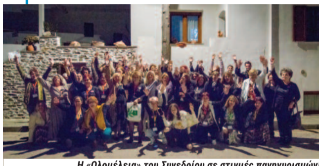
Η «Ολομέλεια» του Συνεδρίου σε στιγμές πανηγυρισμών! (Φωτ. Αρχείο ΟΣΥΓΥ)

Στη μικρή κοινωνία της Τήλου είδα και κατέγραφα ένα μικρό θαύμα: Τη μείωση των απορριμμάτων σχεδόν κατά 90%, με μία διαδικασία που υπόσχεται πολλά και σε μεγαλύτερες κλίμακες, στις πόλεις μας, στη χώρα μας.»