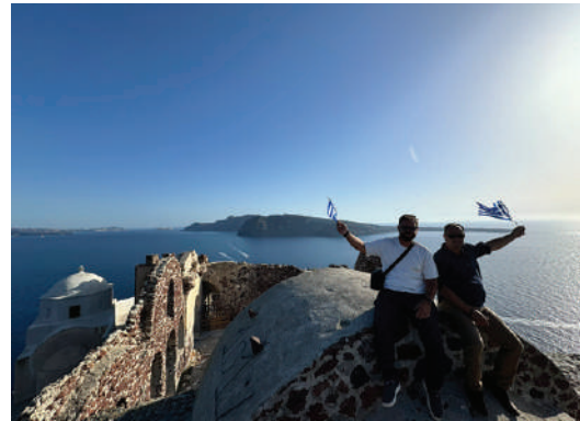
Οι Παριανοί (επάνω) και οι Ναξιώτες (αριστερά) συμμετέχουν με ενθουσιασμό στη Κυκλαδίτικη γιορτή.