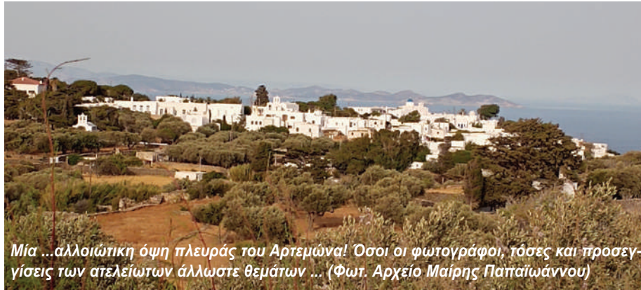
Μία ...αλλοιώτικη όψη πλευράς του Αρτεμώνα! Όσοι οι φωτογράφοι, τόσοι και προσεγγίσεις των ατελείωτων άλλωστε θεμάτων ...

Ίσως δεν μπορούμε πλέον να καλλιεργήσουμε όλα αυτά - έχουν αλλάξει κλιματικές και κοινωνικές συνθήκες - αλλά μπορεί να ανακάμψει η γεωργία αξιοποιώντας ντόπιες ποικιλίες και νέα υποστηρικτικά εργαλεία. Το ότι διασώζονται σήμερα πολλοί ντόπιοι σπόροι και ποικιλίες είναι σημαντικό για την διασφάλιση της μελλοντικής γεωργίας και της τροφής μας, σε μια εποχή αυξανόμενης διατροφικής αβεβαιότητας και καταστροφών στις σοδιές λόγω κλιματικής κρίσης. Σε συνεργασία με τον ερευνητή