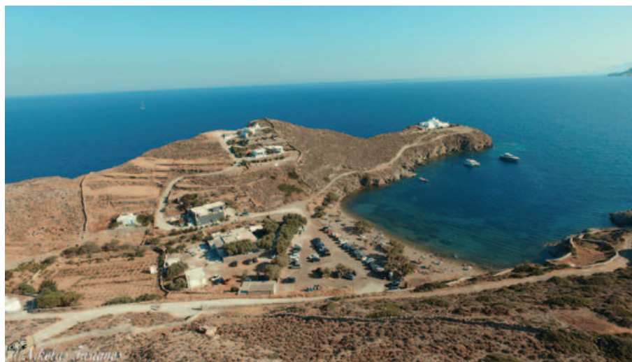
Φασολού και Σταυρός του Φάρου και στο βάθος κάποιες βίλες (:) (Με τη ματιά και το φακό του Νικόλα Φαριανού)

την Τοπική Αυτοδιοίκηση και τον επιχειρηματικό κόσμο, να έχουν στο νου τους ότι η ανάπτυξη όλων των επιπέδων, περιλαμβανομένου και του τουριστικού προϊόντος, πρέπει να βασίζεται στην κοινωνικά και περιβαλλοντικά βιώσιμη ανάπτυξη. Αυτό είναι ένα θέμα όχι μόνο δεοντολογικά και ηθικά απαραίτητο στον πλανήτη για τις επόμενες γενιές, αλλά πλέον σημαντικό για τη βιώσιμη ανταγωνιστικότητα του τουριστικού προϊόντος γιατί αποτελεί και συνειδητή επιλογή των σημερινών καταναλωτών και ταξιδιωτών. Η διαμόρφωση ενός βιώσιμου και περιβαλλοντικά υπεύθυνου τουριστικού προϊόντος αποτελεί μονόδρομο, αν θέλουμε ο ελληνικός τουρισμός να συνεχίσει τη θετική του πορεία και το brand «Ελλάδα» να διατηρηθεί στην κορυφή.