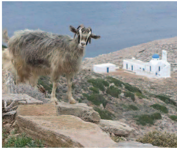
Ο Άη Σώστης στα Μεταλλεία και μία από τις ... «μόνιμες κατοίκους»!

ΣΗΜ. Σ.Ν. Διαβάσαμε το παραπάνω κείμενο στην ΚΑΘΗΜΕΡΙΝΗ και κρίναμε ότι ταιριάζει "γάντι" στην κατάσταση έντονης λειψυδρίας που αντιμετωπίζει το νησί μας και έτσι αποφασίσαμε να το αναδημοσιεύσουμε.