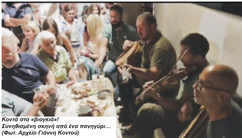
Κοντά στα «βιογκιά»! Συνηθισμένη σκηνή από ένα πανηγύρι...

Το φετινό καλοκαίρι και με αφορμή τα πολλά καλοκαιρινά πανηγύρια, που συμπίπτουν με την παρουσία στο νησί μεγάλου – και κάθε χρόνο μεγαλύτερου – αριθμού επισκεπτών, αναδείχτηκε το πρόβλημα – ο κίνδυνος – αλλοίωσης του χαρακτήρα των πανηγυριών, είτε εξ αιτίας «περίεργων»