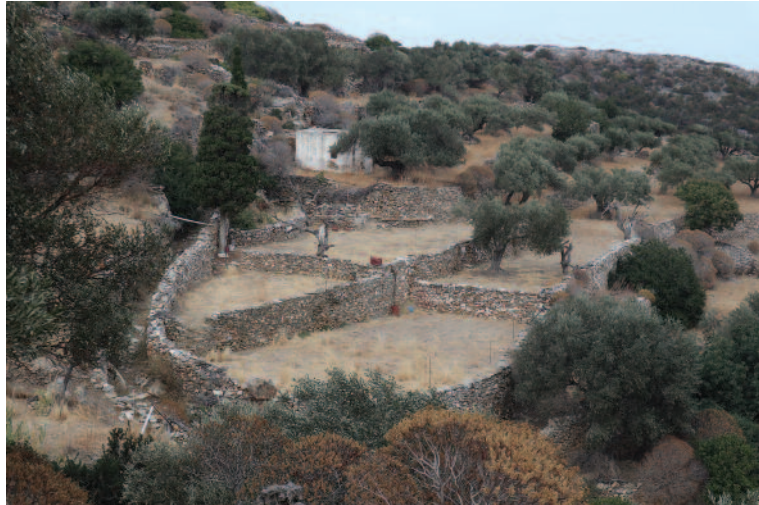
Χωράφι ακριβοδικαία χωρισμένο με ξερολιθιά!

Η Σίφνος είναι ένας τόπος πλούσιος σε ιστορία και παράδοση, με ιδιαίτερη πολιτιστική ταυτότητα που αξίζει να διαφυλαχθεί και να περάσει στις