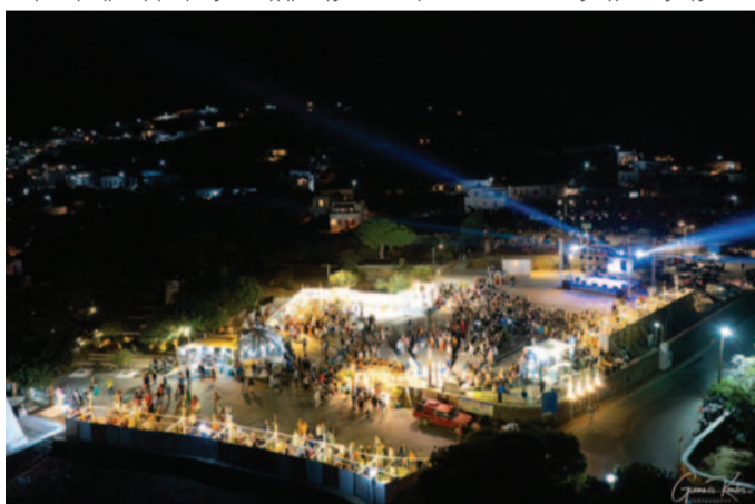
Πανοραμική άποψη του χώρου του φεστιβάλ.

* Τους προσκεκλημένους δημοσιογράφους και τους χορηγούς επικοινωνίας. Η συμβολή τους ήταν κρίσιμη για τη δημιουργία μιας επιτυχημένης