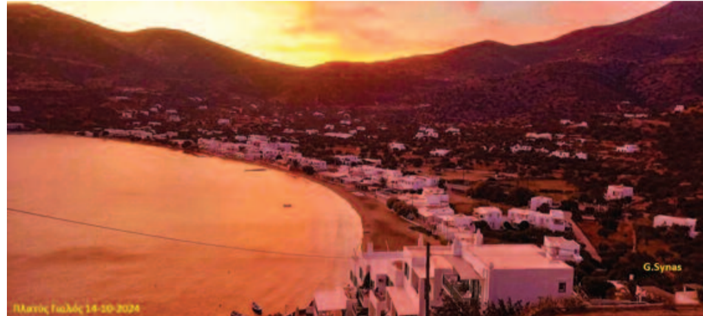
Ο Πλατύς Γαλός: Μια καινούργια πόλη πάνω στο νησί.

- Για τα προβλήματα που δημιουργήθηκαν φέτος, και συνεχίζουν να υφίστανται, με τα δρομολόγια των λεωφορείων, υπεύθυνοι είναι οι «κακοί» ιδιο-