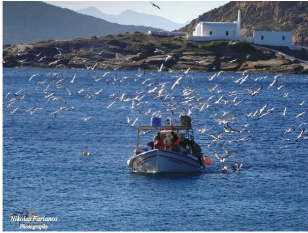
Το πλεούμενο, τα θαλασσοπούλια και η υπέροχη Χρυσοπηγή, όπως τις αιχμαλώτισε ο Νικόλας Φαριανός...

ελάχιστο τεκμαρτό εισόδημα το 2024 θα ανέλθει στα 11.620 ευρώ λόγω αναπροσαρμογής του κατώτερου μισθού, από 10.920 ευρώ το 2023. Εδώ πρέπει να τονίσουμε ότι οι επαγ-