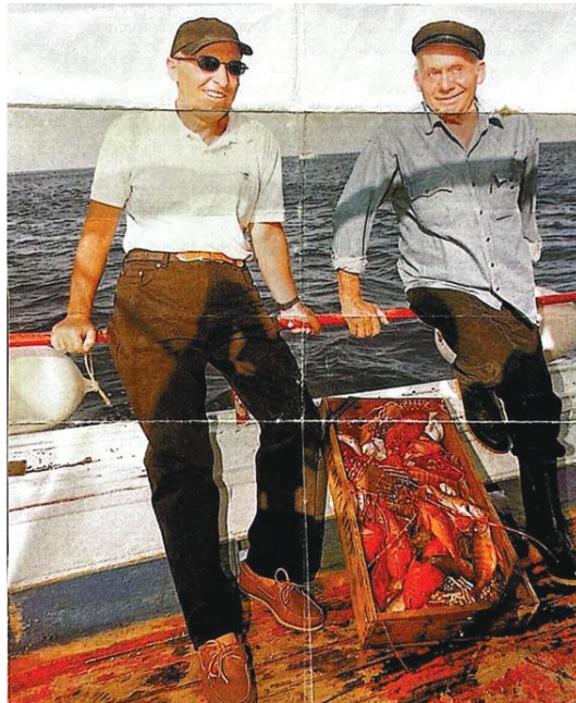
Ο Κώστας Σημίτης με τον «ψαροκαπετάνιο» Νίκο Μπαμπούνη, φίλοι, ομοϊδεάτες και σύντροφοι στο ΠΑΣΟΚ με μια καλή ψαριά ανάμεσά τους, χρόνια πριν ο πρώτος γίνει πρωθυπουργός, μένοντας πάντα λάτρης της Σίφνου.

✂ Η στήριξη του παραδοσιακού επαγγέλματος της αγγειοπλαστικής, ήταν χαρακτηριστικές παρεμβάσεις, που αποδείκνυαν εμπράκτως την αγάπη και το έμπρακτο ενδιαφέρον του για τη Σίφνο μας!